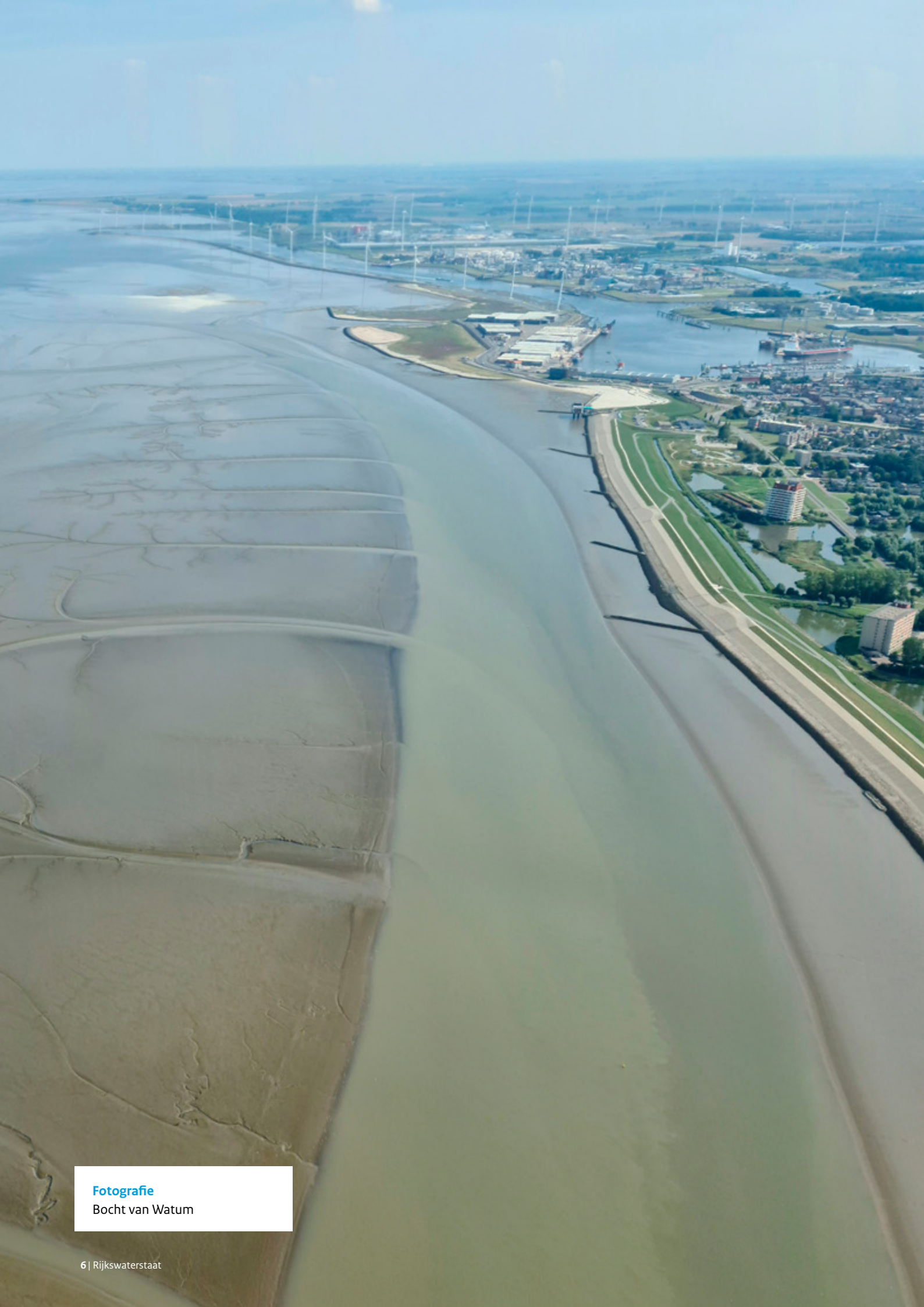
Fotografie Bocht van Watum