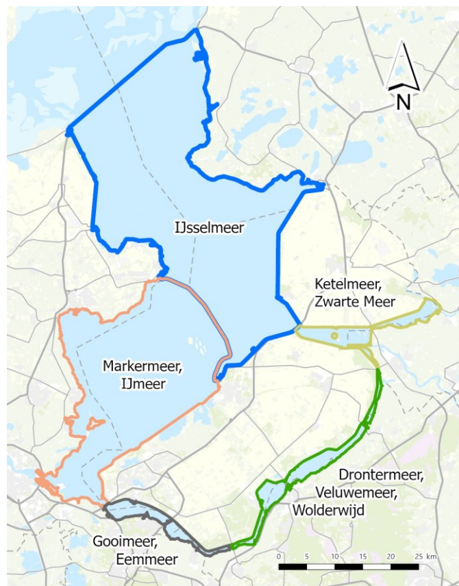
Figuur 1 Schematische weergave IJsselmeergebied met de verschillende wateren.

Met het Programma Zandwinning IJsselmeergebied 2025-2050 vernieuwt het Rijk het beleid voor de winning van bouwgrondstoffen in het IJsselmeergebied (zie figuur 1). Het huidige beleid is toe aan actualisatie. Daarbij lopen de komende 5 jaar meerdere ontgrondingsvergunningen in het gebied af en vermindert het aantal nog te verdiepen vaargeulen. Daarnaast is de verwachting dat er de komende jaren landelijk sprake blijft van een substantiële vraag naar bouwgrondstoffen: het borgen van voldoende bouwgrondstoffen is belangrijk voor de realisatie van de huidige woning-, utiliteits-, infrastructurele en andere bouwopgaven.