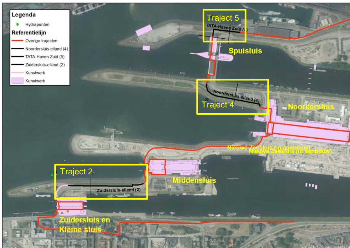
Figuur 1: projectgebied met de sluiseilanden

Het projectgebied betreft een gedeelte van het sluisencomplex bij IJmuiden. Het sluisencomplex bij IJmuiden vormt een verbinding tussen het Noordzeekanaal en de Noordzee. Het sluisencomplex bestaat uit de Zuidersluis, Middensluis, Noordersluis, Spuisluizen en het Gemaal. De waterkering die versterkt moet worden ligt in normtraject 44-3. Samen met de sluisencomplexen IJmuiden vormt de dijk een verbindende waterkering tussen wat voorheen bekend was als dijkkring 13 en 14. De waterkering IJmuiden maakt eveneens onderdeel uit van dijkkring 44 (Noordzeekanaal). De primaire waterkering in IJmuiden heeft een lengte van circa 4,1 kilometer.