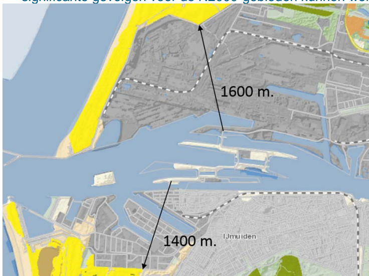
Figuur 4: Begrenzing NNN nabij IJmuiden Noordhollands Duinreservaat (ten noorden gelegen) en Kennemerland-Zuid (ten zuiden gelegen)

Vanwege deze geringe tijdelijke bijdrage van stikstofdepositie is beoordeeld of er mogelijk sprake is van significante gevolgen op de beschermde gebieden Natura 2000. Uit de beoordeling blijkt dat significante gevolgen voor de N2000-gebieden kunnen worden uitgesloten.