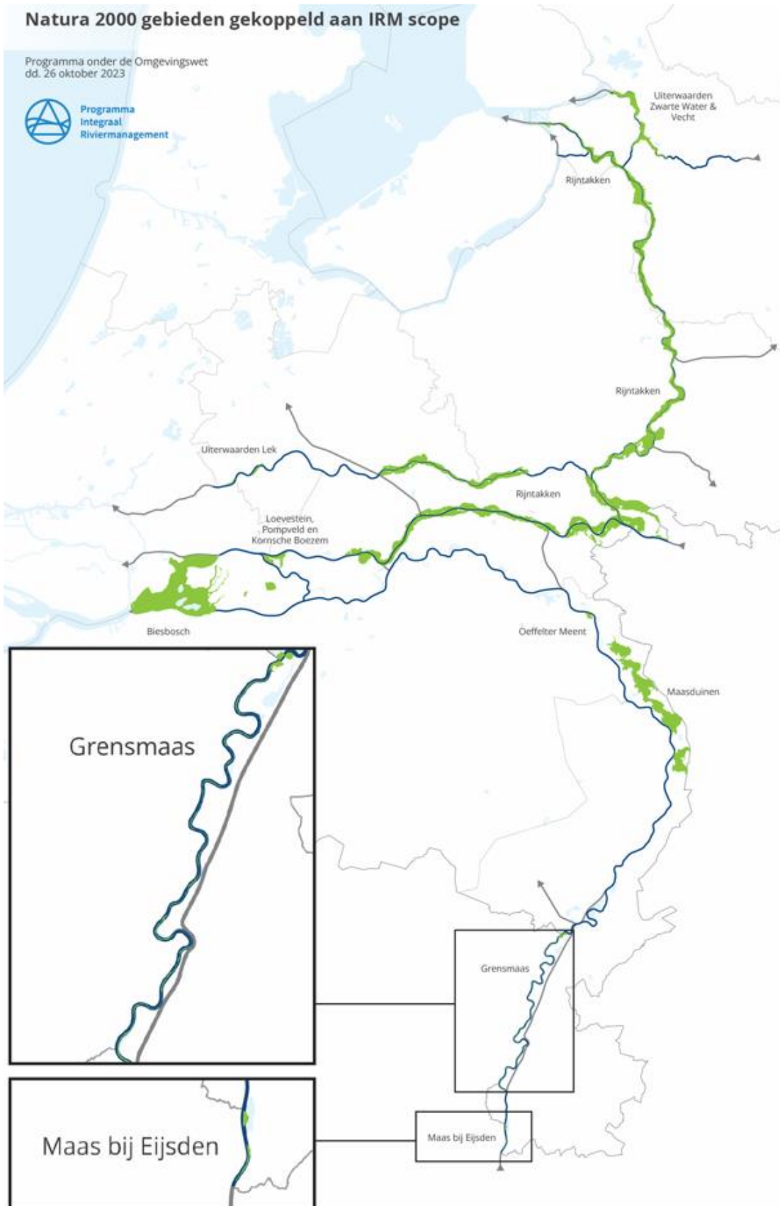
Abbildung 3-1 Lage der Natura 2000-Gebiete im Rahmen des IRM