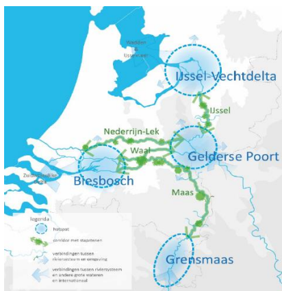
Abbildung 4-4 Darstellung des Naturnetzwerks großer Flüsse (Heusden u.a., 2021)

Im Mittelpunkt steht ein Naturnetzwerk aus vier Kerngebieten (Hotspots), von denen zwei ganz und zwei teilweise im IRM-Plangebiet liegen (siehe Abbildung 4-4). Die Kerngebiete sind durch die Flüsse miteinander verbunden (Korridore und Ausgangspunkte). Nur das Kerngebiet rund um den Gelderse Poort kann wahrscheinlich nicht vollständig hinter dem Deich ausgeglichen werden. Dafür sind zusätzliche Barro-Reservate und vor dem Deich liegende Gebiete nötig.