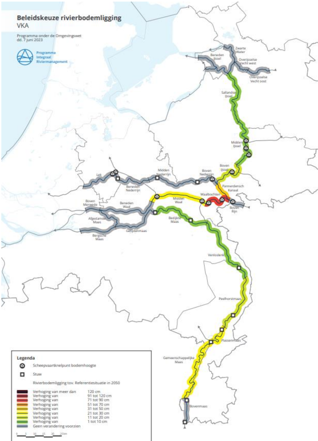
Abbildung 4-1 Politische Entscheidung Flussbettlage