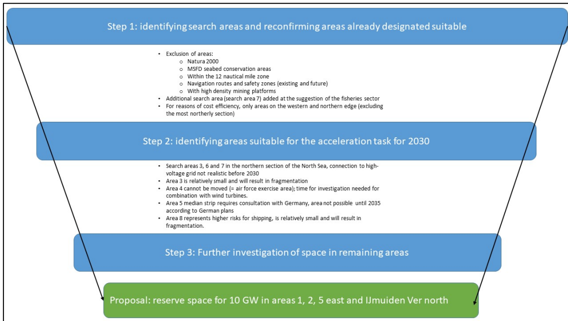
Figure S1 Schéma sélection stratégique des zones d'étude pour l'éolien en mer du Nord