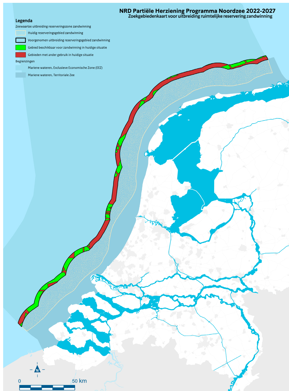
Figuur 1.2 Zoekgebiedenkaart voor uitbreiding ruimtelijke reservering zandwinning. Het huidige reserveringsgebied, tevens referentie, is niet gekleurd. In de voorgenomen zeewaartse uitbreiding van het reserveringsgebied is met groen aangegeven welke gebieden momenteel beschikbaar zijn voor winning. Met rood zijn de gebieden aangegeven waar in de huidige situatie sprake is van ander gebruik. Voor het PlanMER van de PH wordt het hele gebied tussen de 12 NM en de 14 NM lijn beschouwd.