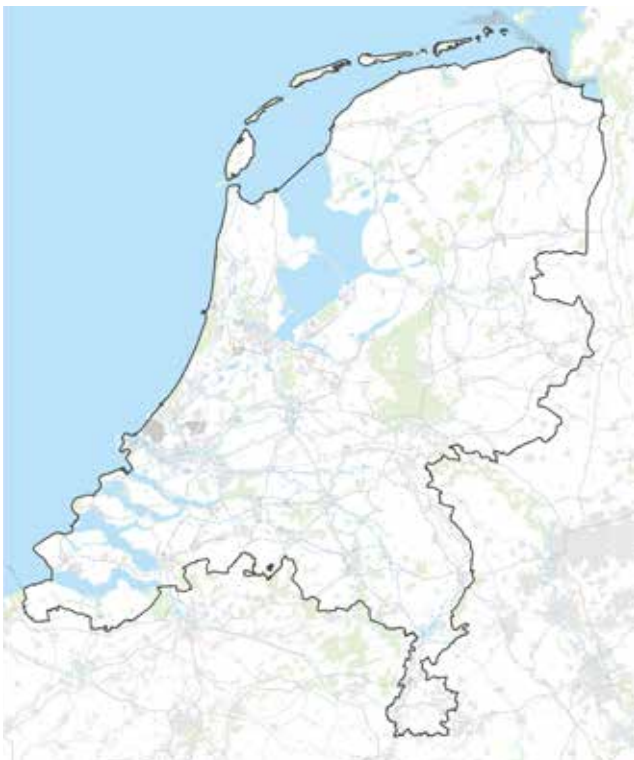
Figuur 1 - Plangebied

Bij de beoordeling van effecten van deze activiteiten wordt ook gekeken welke effecten deze activiteiten hebben op andere activiteiten in de onder- of bovengrond, zoals bijvoorbeeld landbouw en natuur. De effecten van mogelijke schaliegaswinning worden in het planMER voor de Structuurvisie Schaliegas onderzocht. De Structuurvisie Schaliegas zal integraal onderdeel uitmaken van de Structuurvisie Ondergrond.