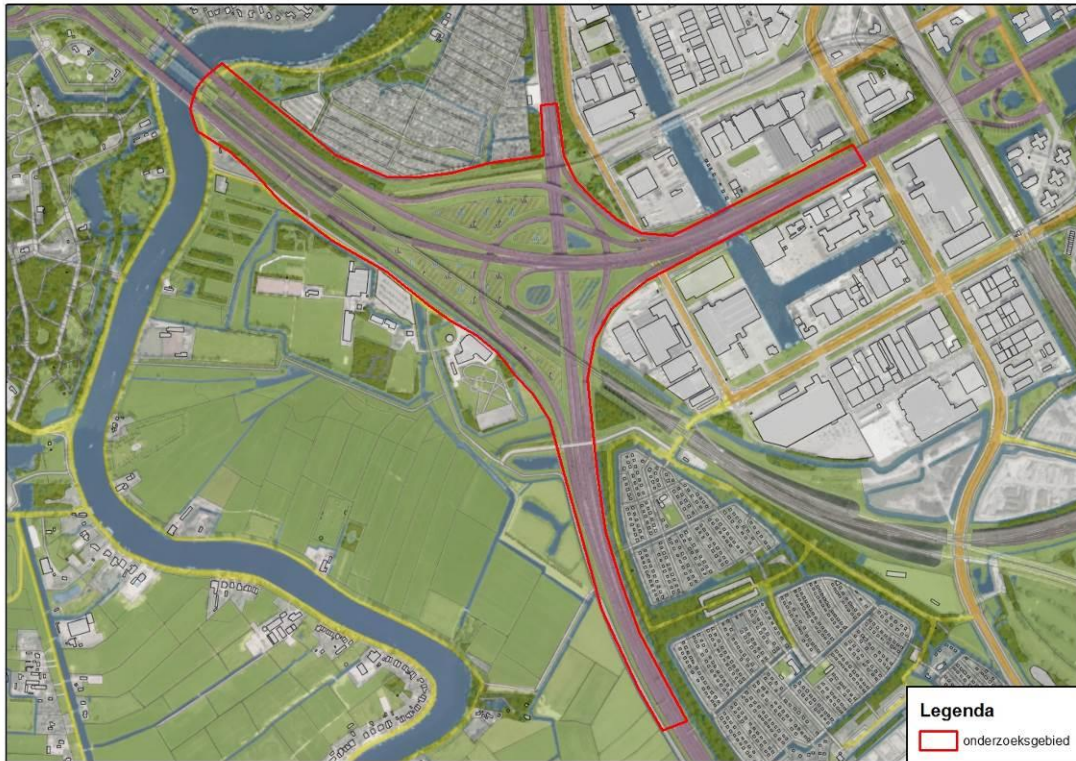
Figuur 1: Onderzoeksgebied bij knooppunt Amstel